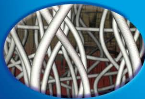
Suva AQUACEL® vlakna