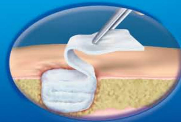
Slika 3. Uklanjanje obloge