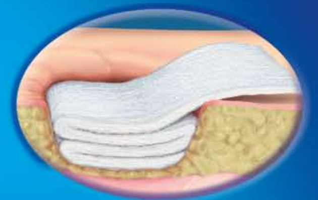
Slika 2. Primena kod dubokih rana