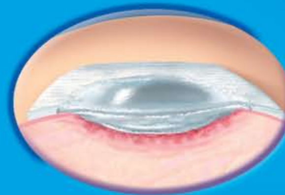
Slika 1. Primena kod površinskih rana